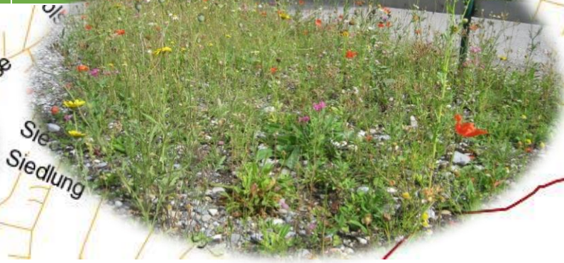
nach 7 Wochen