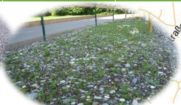
nach 3 Wochen