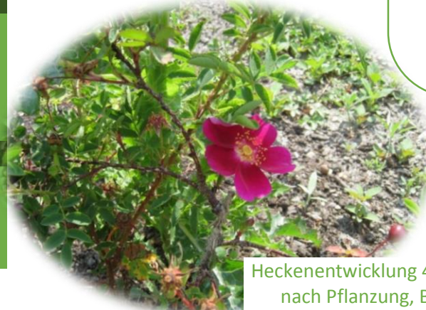
Heckenentwicklung 4 Wochen nach Pflanzung, Bofel 3

Gemeindeblattbeitrag der Region vom Netzwerk blühendes Vorarlberg Vortrag/ Infomaterial – Aula Altach „Was kann ich den Bienen Gutes tun“ Werbung – Vorarlberger Bienenmarkt, Altacher Kreativmarkt Werbung – Umweltwoche Vorstellung Jungbienenstand (Sauwinkel)