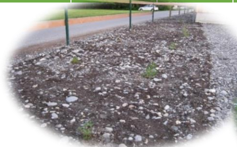
Aussaat Mai 2014

Entwicklung Syringa-Saatgut: Sonnige Blumenwiese Bofel 4