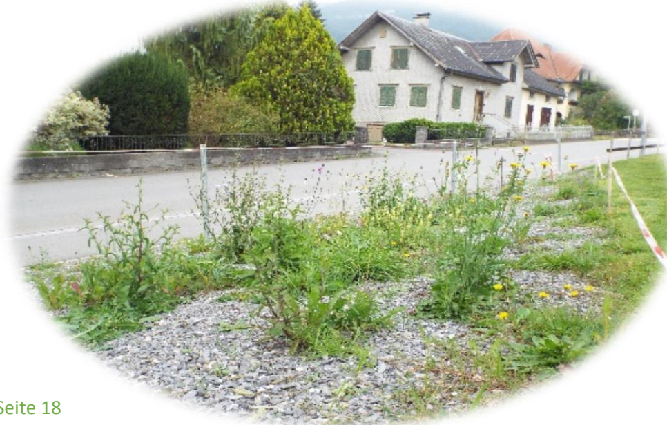
Geißenpark September 2014